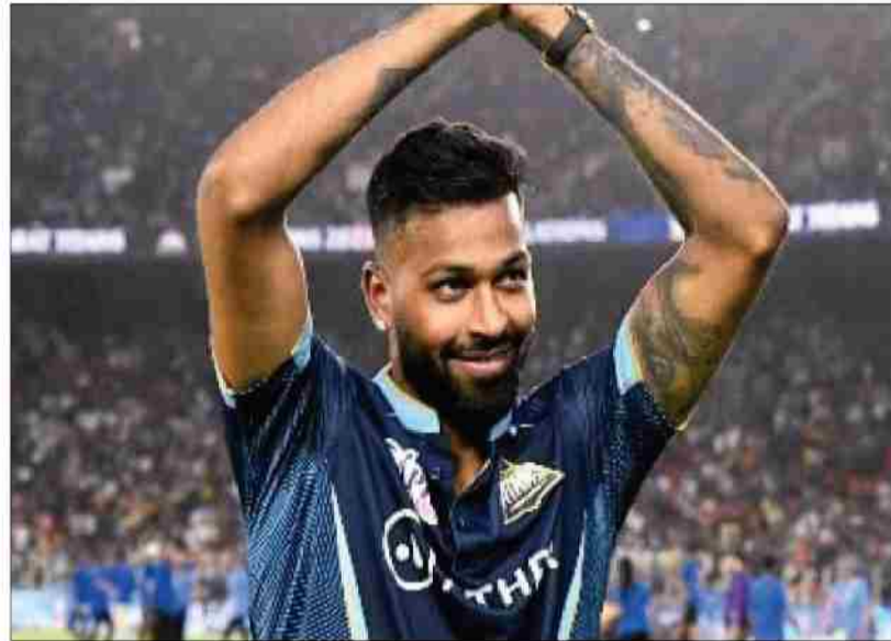
साथ विश्व खिताब के करीब पहुंचे पर तीनों ही बार टीम जीत नहीं पायी। साल 2016 में, बांग्लादेश के खिलाफ उनके अंतिम ओवर में भारत को टी 20 विश्व कप के सेमीफाइनल में पहुंचाया पर खिताबी मुकाबले में भारतीय टीम बेंगलूर की आक्रामक बल्लेबाजी के कारण वेस्टइंडीज से हार गयी। वहीं 2017 में