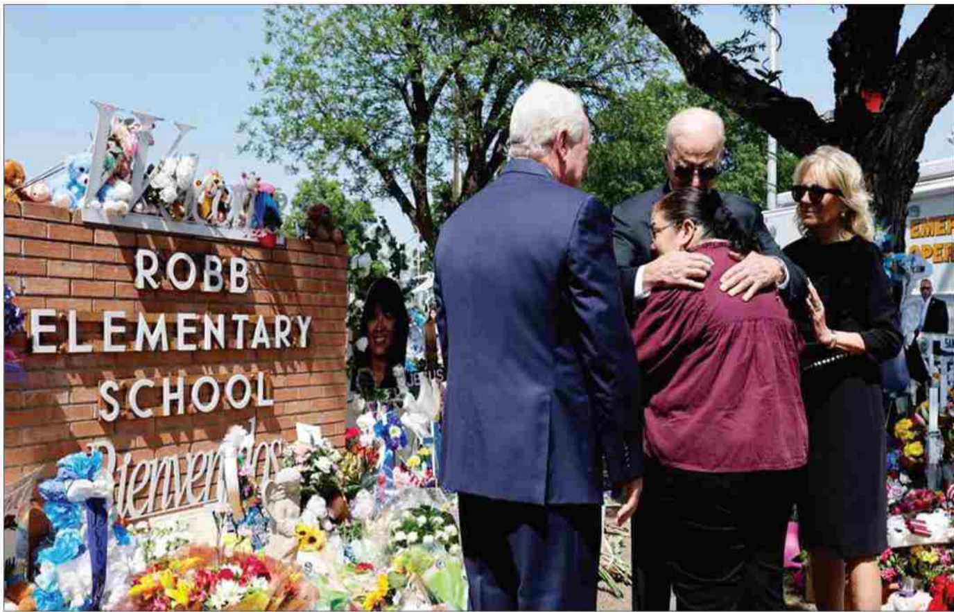
टेक्सास में अमेरिकी राष्ट्रपति जो बाइडेन रोब एलीमेंट्री स्कूल की प्रिंसिपल को दिलासा देते हुए, इसी स्कूल में एक बंदूकधारी की गोली से कई बच्चों की मौत हुई थी।