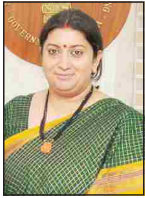
स्मृति इरानी केन्द्रीय मंत्री

जब देश आजादी का अमृत महोत्सव मना रहा है, प्रधानमंत्री मोदी के नेतृत्व में सरकार ने 'नारी शक्ति' के नए युग की शुरुआत की है। कार्यक्रम संबंधी हस्तक्षेपों द्वारा महिलाओं को मुख्यधारा में लाने के भारत के प्रयासों को मिला प्रशंसा इसके प्रमाण हैं। महिलाओं को मुख्यधारा में लाने के ये प्रयास केवल कागजों तक सीमित नहीं रहे, बल्कि इन्हें जमीनी स्तर पर लागू किया गया है। महिलाएं अब उन अकल्पनीय नीतियों का विषय नहीं हैं, जिनका लक्ष्य इन्हें माताओं और पत्नियों की भूमिकाओं में सीमित करना है। इस अमृत काल में, महिलाएं हरेक क्षेत्र में नेतृत्व कर रही हैं, श्रम शक्ति में अनुकूल स्थिति में हैं और भारतीय समाज की केंद्र बिन्दु हैं।