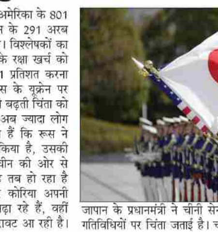
जापान के प्रधानमंत्री ने चीनी सेना की गतिविधियों पर चिंता जताई है। चीन ने

करेगा। उल्लेखनीय है कि यूक्रेन पर हमले के पहले ही जापान की सत्तारूढ़ पार्टी एलडीपी ने एक ज्यादा मजबूत रक्षा नीति पर फोकस शुरू कर दिया था। एलडीपी ने अगले 5 साल के लिए रक्षा पर खर्च को जीडीपी का 1 से 2 प्रतिशत करने का प्रस्ताव दिया था। जापान दुनिया का सबसे बड़ा अर्थव्यवस्था है। जापान अपनी जीडीपी का अगर 2 प्रतिशत रक्षा पर खर्च करता है, तो वह दुनिया की तीसरी बड़ी सैन्य ताकत बन जाएगा। जापान अभी रक्षा पर खर्च के मामले में 9वें नंबर पर है। जापान ने साल 2021 में 54.1 अरब