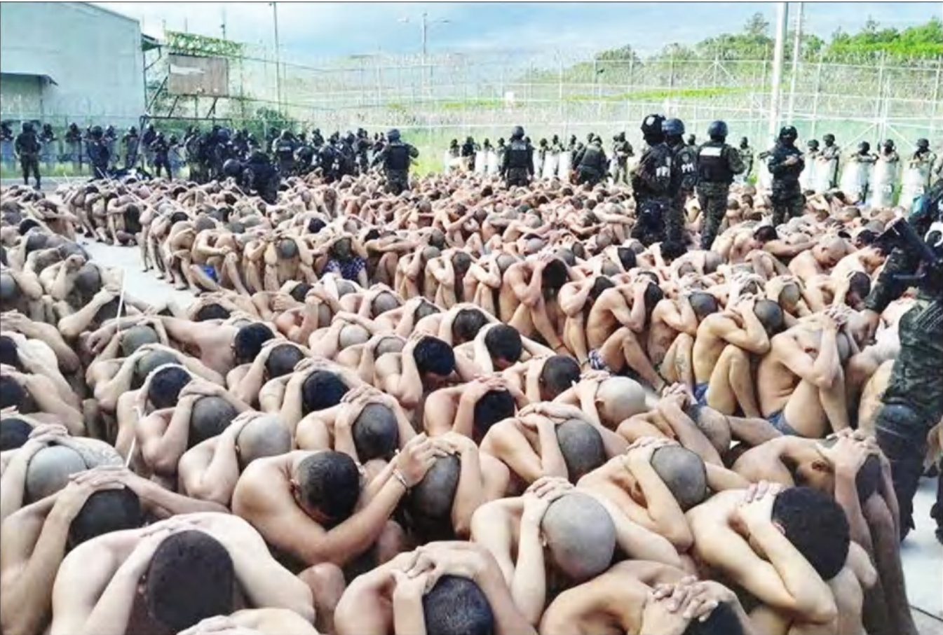
होंडूरास में मिलिटरी पुलिस ने देश भर के कारावासों का नियंत्रण अपने हाथों में लेने के साथ ही वहां बंद विभिन्न गैंग के अपराधियों पर नजर रखनी शुरु कर दी।