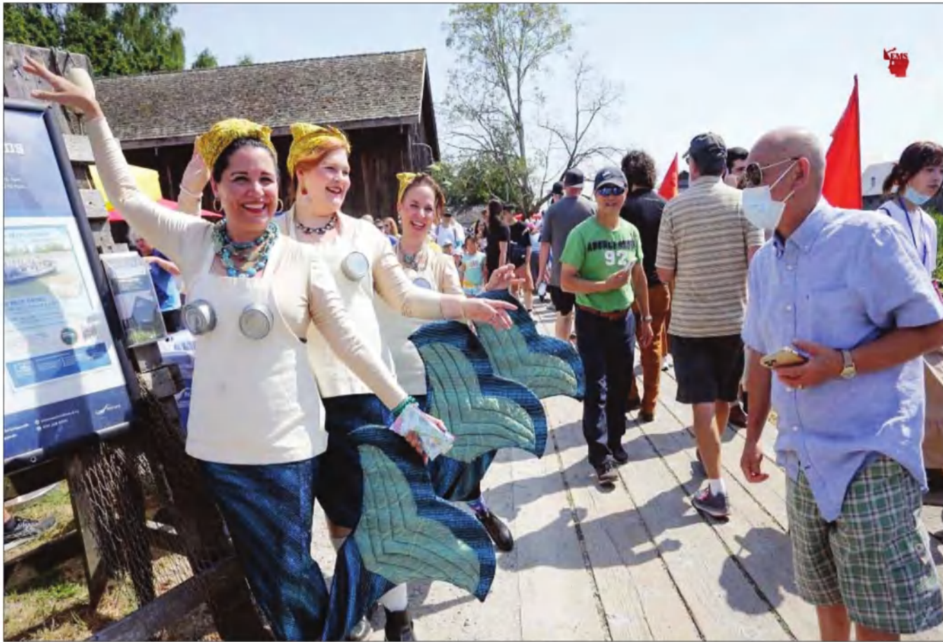
कनाडा में रिचमंड मैरीटाइम फेस्टीवल में भाग लेने के लिए पहुंचे प्रतिभागी।

लंदन। ब्रिटेन में इन दिनों भारतीय मूल के ऋषि सुनक की चर्चा जोरो पर है वे यहां के प्रधानमंत्री बनने की दौड़ में शामिल हैं और विदेश मंत्री लिज टस के उनका मुकाबला है। ऋषि सुनक लगातार कहते रहे हैं कि वह जनता को खुश करने के लिए कोई वादा नहीं कर सकते। ऋषि लगातार कहते रहे हैं कि टैक्स में कटौती नहीं की जा सकती। वहीं, लिज टस अपने भाषणों में पीएम बनने के बाद टुरंट टैक्स छूट का वादा कर रही हैं, जिसे ऋषि सुनक एक खराब फैसला बताते आए हैं। अब ऋषि सुनक को कंजर्वेटिव पार्टी के एक वरिष्ठ सांसद और टोरी सदस्य का समर्थन मिला है। पूर्व मंत्री माइकल गोव ने कहा है कि ऋषि सुनक के पास वह कालिंदी है जो प्रधानमंत्री बनने के लिए चाहिए। माइकल गोव को नाटकीय रूप से पिछले महीने निवर्तमान प्रधानमंत्री बोरिस जॉनसन ने बर्खास्त कर दिया था। गोव ने प्रधानमंत्री बनने की रेस में आगे चल रही, लिज टस की कर-कटौती योजना को वास्तविकता से परे बताया। उन्होंने कहा कि नेतृत्व के मामले में ऋषि सुनक ही सही तर्क दे रहे हैं। वहीं है जो मुकदमाओं को सच बता रहे हैं। गोव ने लिखा, 'मुझे पता है कि प्रधानमंत्री बनने के लिए क्या कालिंदी चाहिए और ऋषि के पास वह है।' जन्माष्टमी के ठीक बाद लिखे लेख में गोव ने कहा, 'इससे भी ज्यादा महत्वपूर्ण है कि आपने वाली सरकार अपनी केंद्रीय आर्थिक योजना के रूप में क्या अनुशासना है।' इस बात को लेकर चिंतित हूँ कि कई लोगों द्वारा नेतृत्व की बहस वास्तविकता से अलग है। कॉन्स्ट ऑफ लिविंग एक चुनौती है, लेकिन इसके लिए सबसे आसान जवाब करो में कटौती नहीं हो सकती है।'