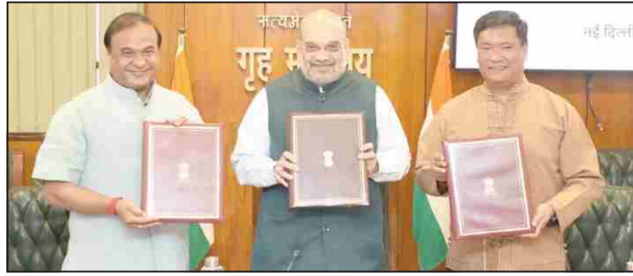
असम कैबिनेट ने अरुणाचल प्रदेश के साथ दशकों से चल रहे सीमा विवाद के मुद्दे को हल करने के लिए राज्य सरकार की गठित 12 क्षेत्रीय समितियों द्वारा दी गई सिफारिशों को बुधवार (19 अप्रैल) को मंजूरी दी थी। कैबिनेट के फैसलों की घोषणा करते हुए असम के मंत्री अशोक सिंघल ने कहा था कि असम और अरुणाचल प्रदेश के बीच लंबे समय से लंबित सीमा विवाद का मुद्दा सुलझने जा रहा है।

विवाद खत्म हो गए हैं। असम के सीएम हिमंत बिस्व सरमा ने कहा, सीमा समझौता 'बड़ा और सफल' क्षण। वहीं, अरुणाचल प्रदेश के सीएम पेमा खांडू ने इसे 'ऐतिहासिक' बताया। हिमंत बिस्व सरमा ने कहा कि असम और अरुणाचल प्रदेश के बीच 1972 से सीमा विवाद था। आज हमने सभी विवादों को बातचीत के जरिये सुलझा लिया है। गृह मंत्री शाह के मार्गदर्शन में प्रधानमंत्री नरेंद्र मोदी के आशीर्वाद से यह विवाद सुलझ गया है, यह एक मील का पत्थर साबित होगा।